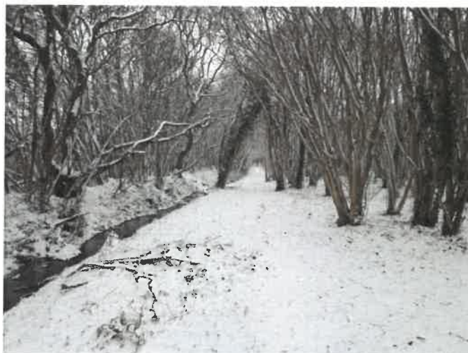
Photo : chemin de randonnée bois de Kerello

Pensez à consulter le site internet de la commune !