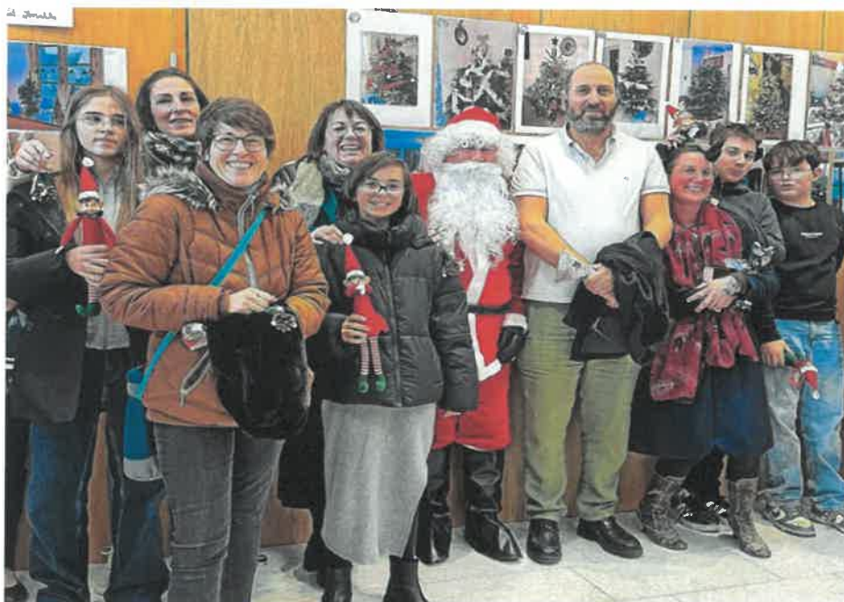
Membres du jury

Chaque adulte a reçu une petite figurine de Noël et les enfants un lutin farceur.